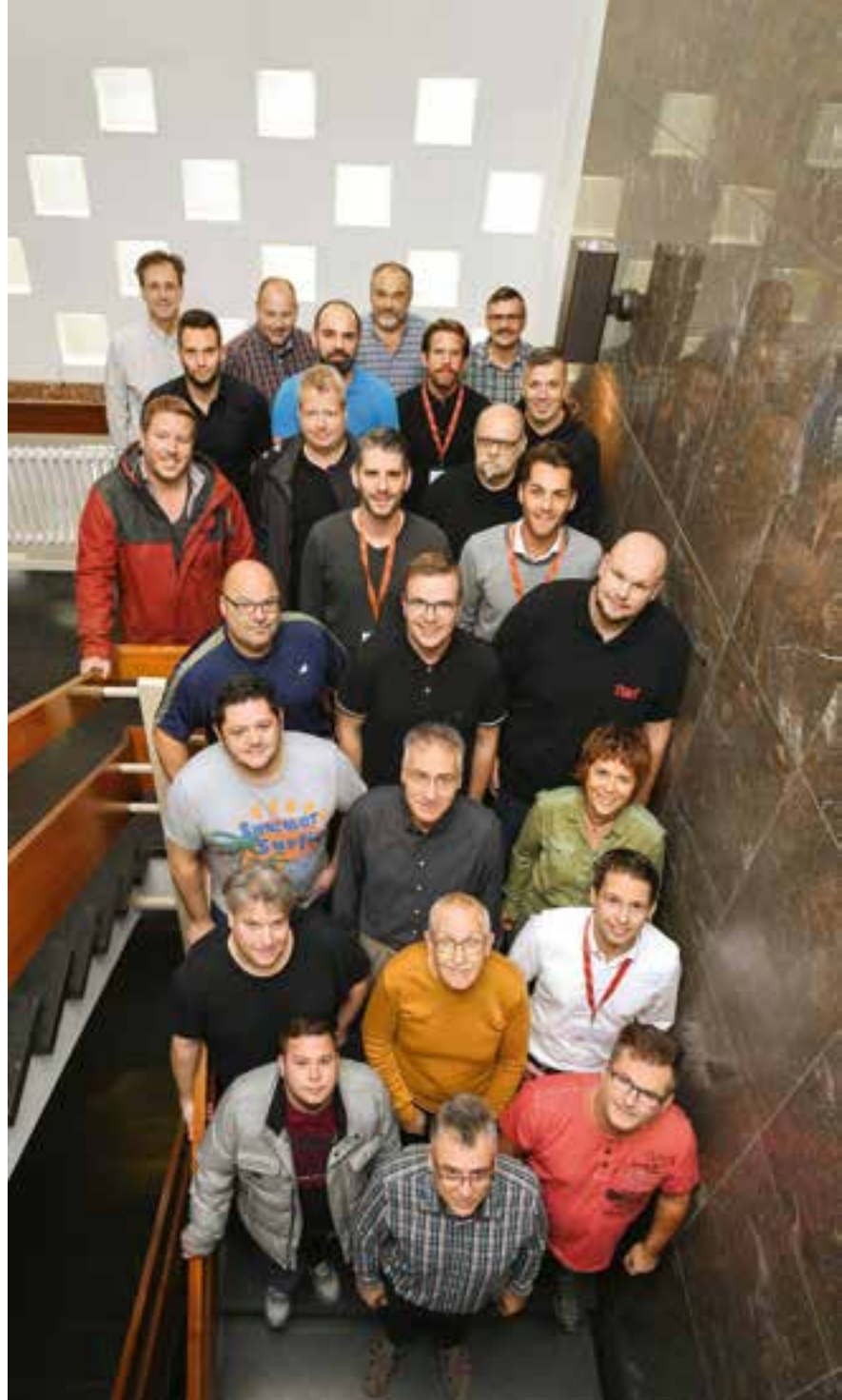
143 Mitarbeiter meldeten sich freiwillig um am Projekt Technik 3.0 mitzuarbeiten

TWL nutzt die Kriterien und den dynamischen Bewertungsrahmen des EFQM-Modells, um seine Position zu bestimmen.