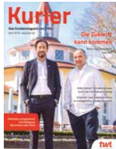
Gemeinsam sind wir stark: TWL setzt auf den aktiven Austausch mit Kunden