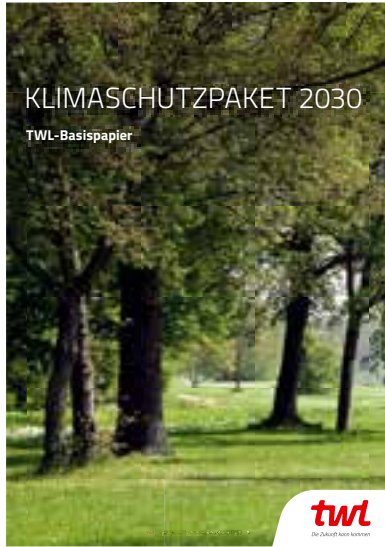
TWL goes green: Das Basispapier von TWL zur Umsetzung des Klimaschutzpakets 2030 der Bundesregierung

Als hundertprozentige Tochter der Stadt Ludwigshafen stehen wir im ständigen Dialog mit Vertretern der Stadt und der Politik sowie mit Verbänden. Für die Politik,