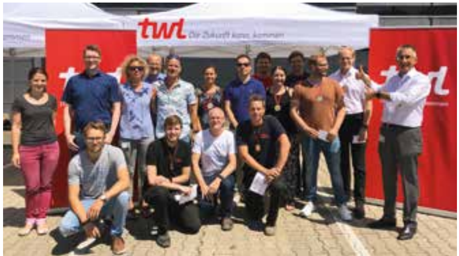
TWL war auch 2019 erfolgreich beim Stadtlauf vertreten

In der Betriebsvereinbarung ist ebenfalls die Verfahrensweise geregelt, wie neue Planstellenbeschreibungen aufgestellt oder existierende Beschreibungen angepasst werden können. Neu an der Betriebsvereinbarung ist auch das sogenannte Entwicklungsgespräch. Im Rahmen dieses jährlichen Gesprächs können die Beschreibung und Bewertung der eigenen Planstelle mit der jeweiligen Führungskraft thematisiert werden. Das schafft Transparenz bei der Beurteilung der eigenen Eingruppierung und fördert gleichzeitig die Kommunikation mit der Führungskraft über Entwicklungschancen und Perspektiven.