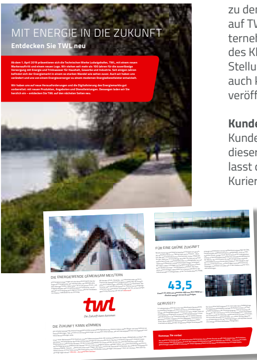
Fit für die Zukunft: TWL präsentiert sich im neuen Imageflyer im frischen Look

Eine weitere wichtige Säule der Weiterentwicklung von TWL sind Ausbildung und Studium. Neben den klassischen Lehrberufen bilden wir Bachelor-Studenten zusammen mit der Dualen Hochschule Baden-Württemberg am Standort in Mannheim aus. Darüber hinaus sind wir an Forschungsprojekten wie beispielsweise DESIGNETZ und DYNEEF beteiligt und pflegen den Kontakt zu Hochschulen und wissenschaftlichen Einrichtungen.